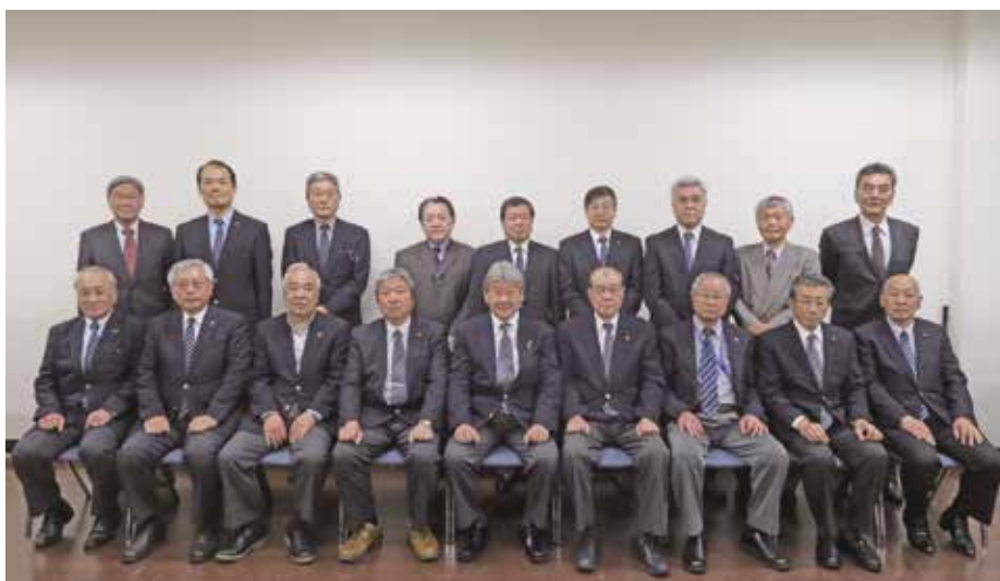
第25期横浜市青少年指導員連絡協議会集合写真